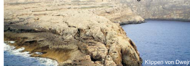
Klippen von Dwejra

GEOPULS als Reiseveranstalter wurde 2004 von Dozenten des Geographischen Instituts in Tübingen gegründet. Bei allen Exkursionen werden Sie von qualifizierten Geographen und Landeskundlern geführt, die Natur, Kultur und Hintergründe eines Ziellandes umfangreich vermitteln. Bei einer Reise mit Geographen gibt es, neben den touristischen Höhepunkten, immer noch etwas mehr zu sehen und zu erleben. Wenig Bekanntes, tiefe Einblicke, das Erkennen von Zusammenhängen in Kultur- und Naturraum, Hintergründiges. Ausflüge in die Natur mit der einen oder anderen kleinen Wanderung gehören dazu, um auch die landschaftlichen Besonderheiten und deren Schönheit kennen zu lernen und zu genießen. Dies funktioniert am besten in einer überschaubaren Gruppe, weshalb die Teilnehmerzahl bei allen Reisen begrenzt ist.