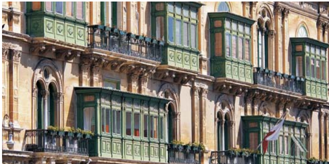
die für ganz Malta typischen Balkone sind ein Erbe aus arabischer Zeit

Nach der Anmeldung zu dieser Exkursion wird mit der von GEOPULS zugesandten Buchungsbestätigung eine Anzahlung (15 % des Reisepreises) fällig. Die Restzahlung erfolgt zwei Wochen vor Reisebeginn. Es gelten die Geschäftsbedingungen des Veranstalters: Geopuls-Studienreisen, Neckarhalde 62, 72108 Rottenburg a.N. (Tel. 07472-9808802). Die Allgemeinen Reisebedingungen werden gerne vorab zugeschickt. Sie können bei der VHS eingesehen, oder auch von der Homepage www.geopuls.de ausgedruckt werden.