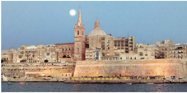
abendliche Silhouette von Valletta